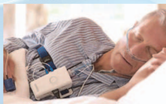
Polygraphie ambulatoire avec Alice-PDx de Philips

Vous pouvez nous référer directement vos patients ronfleurs qui désirent savoir si ils font de l'apnée du sommeil, la plupart des compagnies d'assurance couvrent ce test diagnostique.